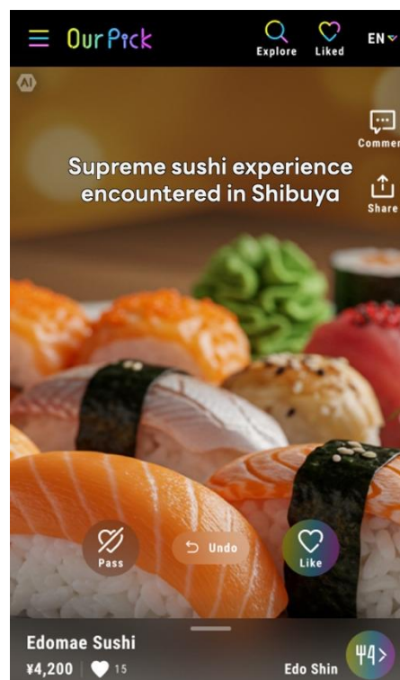
「OurPick」で視聴できる動画のイメージ

本実証は、東京都・公益財団法人東京観光財団の「AI 等先端技術を活用した受入環境高度化支援事業」に、東急不動産、東急不動産 SC マネジメントおよび東急リゾーツ&ステイが「東急不動産HD広域渋谷圏まちづくりグループ」として応募し採択されたもので、ソフトバンクはAI マルチエージェントおよび「OurPick」の開発を担っています。