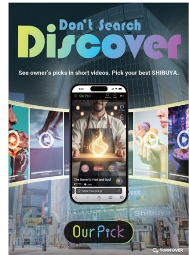
地域特化型プロモーションサービス「OurPick」

本実証では、全体を統括するディレクター役の AI エージェントの下、動画制作の各工程に特化した AI エージェントに分担・連携させる、ソフトバンクの AI マルチエージェント技術を活用します。商品名や商品の魅力と、写真数点を入力すると日本語・英語・韓国語・中国語（簡体）・中国語（繁体）の 5 言語でショート動画を自動で生成します。それぞれの言語圏のトレンドに合わせたテイストの動画を生成することも可能です。この技術で、「渋谷フクラス」や「Shibuya Sakura Stage（渋谷サクラステージ）」および東急プラザ原宿「ハラカド」をはじめとする広域渋谷圏の店舗のプロモーション動画を作成し、東急不動産が新たに提供する地域特化型ウェブサービス「OurPick」で 12 月 1 日に配信を開始しました。ユーザーは手持ちのスマートフォンやタブレットから「OurPick」にアクセスして視聴できる他、渋谷フクラスおよび渋谷サクラステージに設置されたタッチ式のサイネージや、「東急ステイ