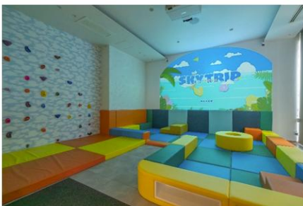
東急ステイ沖縄那覇 「SKY TRIP」 アナログとデジタルが交わるキッズスペース

【姉妹ブランド】nol kyoto sanjo（京都市中京区）、nol hakone myojindai（神奈川県箱根町）