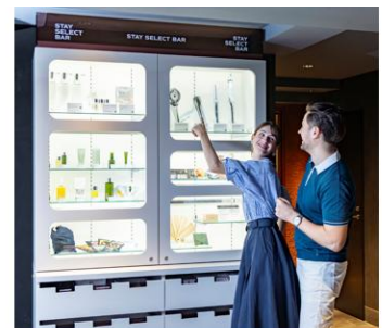
“セルフ”アメニティボックス「STAY SELECT BAR」 日本の美意識を持つブランドの厳選セレクト商品