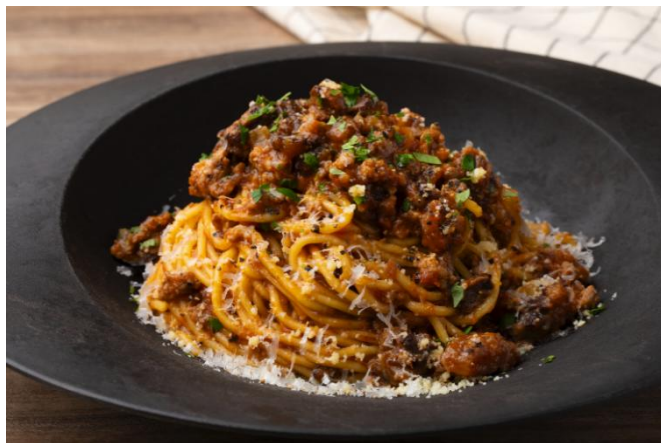
「EZARO」オリジナルメニューイメージ

朝食は、エッグベネディクトや和牛のラグーラザニアなどのメイン料理、健康と美をテーマとした20種以上のドリンクが楽しめます。またランチでは、焼き立てパンのほかパスタや2種のメイン料理が選べるランチプレートをご提供します。どちらの時間帯も、千葉県、茨城県などの近県や北海道から直送される野菜を自分好みに組み合わせるグリーンサラダやスープをビュッフェスタイルでお好きなだけお召し上がりいただけます。