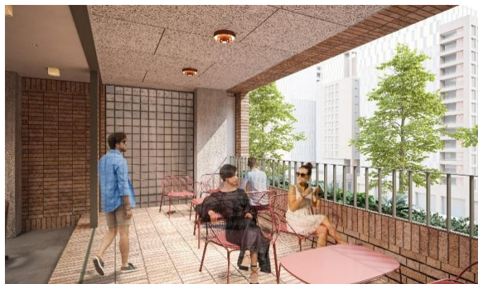
オールデイダイニング「EZARO」イメージ