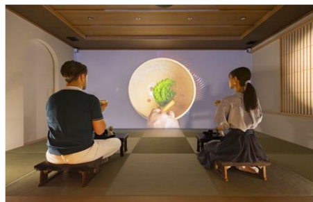
HANARE by Tokyu Stay 「茶幻～sagen～」 伝統文化とテクノロジーが融合したデジタル茶室空間