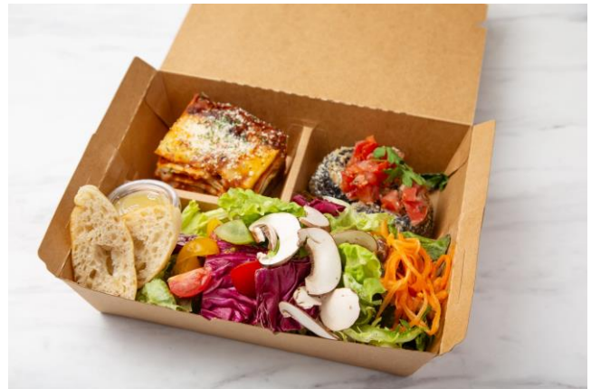
スタンダードイメージ