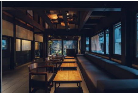
キンシ正宗など日本酒を楽しめるラウンジ