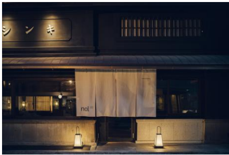
nol_kyoto sanjo 外観

Instagram： https://www.instagram.com/nol_kyoto_sanjo/