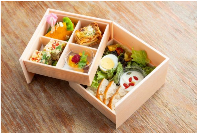
グレードアップイメージ