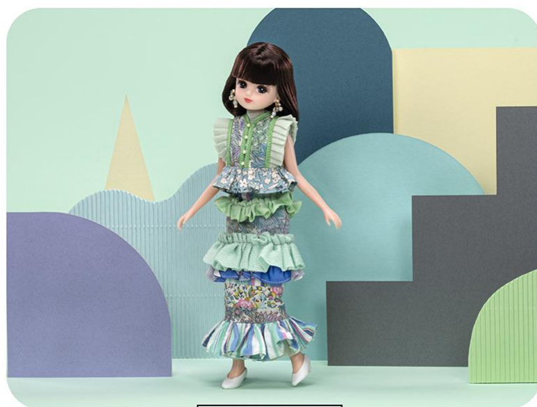
新宿イーストサイド

全国31施設での展示は4月1日（火）より順次開催いたします。展示スケジュールは施設ごとに異なるため、特設WEBサイトにてご確認ください。