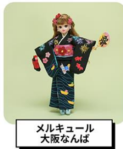
メルキュール 大阪なんば