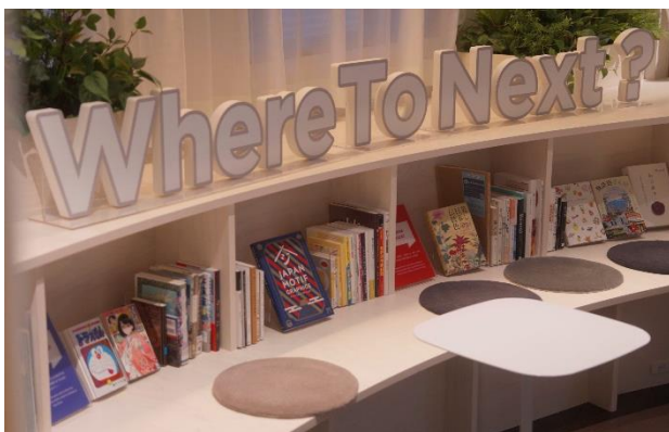
日版グループ (株)ひらくとの連携

「ここでの新しい発見が、明日からの暮らしを変える」これこそが、東急ステイの目指すホテル体験です。