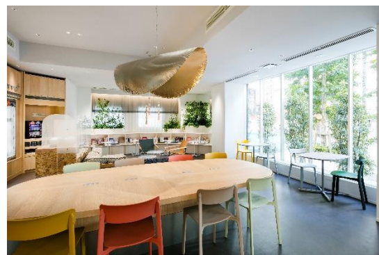
様々な書籍と出合える場となる 「トラベルライブラリー」

ロビーエリアは日販グループの株式会社ひらく協力のもと、約100冊の本が並ぶ「トラベルライブラリー」へと一新。リラックスする際のお供として、また旅のプランを立てる際のヒントとしてなど、新たな本との出会いで、新たな自分らしい旅をデザインしていただける空間となりました。