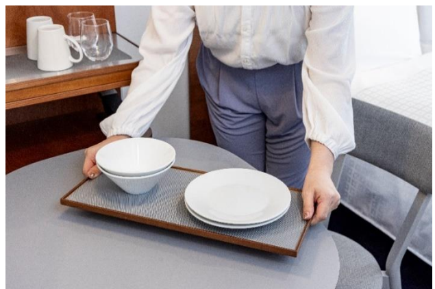
食器棚からそのまま引き出しトレイとして使用可能