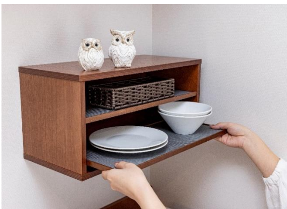
全室に食器棚と食器を設置

新たな客室「シアター・ダイニング」では、客室内での食事のしやすさも追求しつつ、リラックスできる場として、また仕事をしたり 1 日の予定を立てたりする場として、お客様一人ひとりの過ごし方に寄り添い、テーブルをステージへと見立て、自分だけのストーリーが生まれるような空間作りを実現しています。