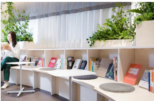
ユニークな約100冊の書籍が並ぶ「トラベルライブラリー」

また「トラベルライブラリー」オープンを記念し、「ブックディレクター」「ローカルガイドガチャ」をキーワードとしたイベントを今後実施する予定です。