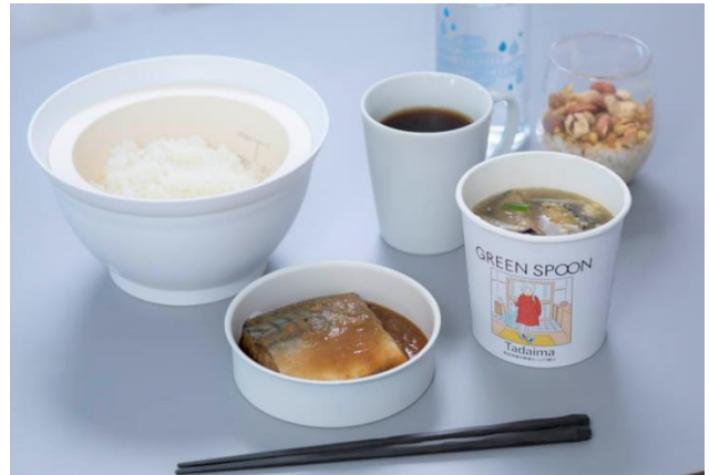
「どんぶりセット」盛り付け例