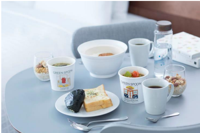
「ステイモーニング+」盛り付け例

今回のリニューアルと併せ、朝食サービスとして新たに「ステイモーニング+（プラス）」の提供を開始いたします。レンジで温めるだけの「おてがるセット」、お部屋で炊きたてのごはんが食べられる「どんぶりセット」の2種類をご用意し、お好みでお選びいただけます。フードロス削減を目指し、野菜たっぷり「GREEN SPOON」製の冷凍スープや和惣菜など、ヘルシーで味わい深いメニューを多数取り揃えています。