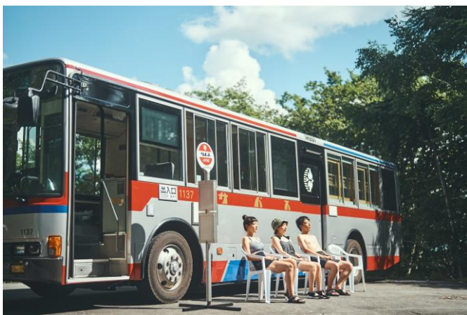
バス停で「ととのい」待ち

秋が深まり空気も一層澄むこの季節だからこそ、車窓からの景色を楽しみながら斑尾ならではの心地よい“ととのい”を体験いただけます。