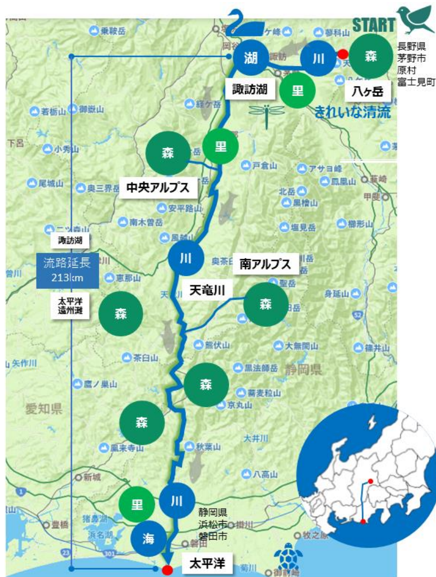
天竜川流域図（八ヶ岳～諏訪湖～天竜川～太平洋へ）

今回の「もりフェス」は第1回として「森」をテーマとしていますが、第2回「里」、第3回「川」、第4回「海」とテーマを変えながら継続的に開催することで、より豊かで自然と共生した未来を作ること、一人一人のライフスタイルシフトを生み出すことを目的としています。