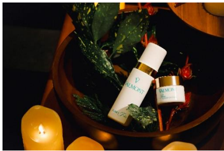
THE ROKU SPA ホリデートリート 2024

「THE ROKU SPA」がお贈りするフェスティブシーズン限定のペアトリートメントプラン「THE ROKU SPA ホリデートリート 2024」では、隣接するしょうざんリゾート京都から湧き出る、アルカリ性単純温泉風呂での入浴でゆっくりと身体を温めていただいた後、スイス発のスキンケアブランド・ヴァルモンによる ROKU KYOTO オリジナルボディ&フェイシャルトリートメントをたっぷり 90 分間ご体験いただけます。「ヴァイタリティ オブ ザ ボディ by ROKU」で疲れた身体を解き放ち、「エクスクルーシブ ROKU ヴァルモン フェイシャル」で肌へ栄養とエネルギーを与えていきます。長いストロークでゆったりと全身をほぐしていくエフルラージュの手法と、ヴァルモン独自のバタフライムーブメントの両方を取り入れることで、肌に活力を与えると同時に神経の緊張を緩和させ、五感を解き覚ますリラクセスした状態へと導きます。ROKU KYOTO だけでお楽しみいただける 2 つのトリートメントの余韻とともに、北山杉やヒノキ、柚子が香る THE ROKU SPA オリジナルボディオイルをお土産としてお持ち帰りいただけます。1 年間頑張った自分たちへのご褒美に、ホリデーシーズンのお出掛けに向けた自分磨きとして、THE ROKU SPA にて至福のリラックスタイムをご体験ください。