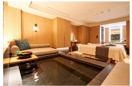
天然温泉風呂付きペアルーム