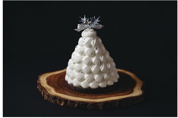
Sapin de Noël (サパン デュ ノエル)

甘酸っぱい苺とラズベリー、風味豊かなピスタチオ、クリーミーな味わいのホワイトチョコレートと、3種のムースで仕立てるリースケーキ。アクセントにクランチやベリージュレを中心に忍ばせ、仕上げにオーナメントムースを飾り付けました。