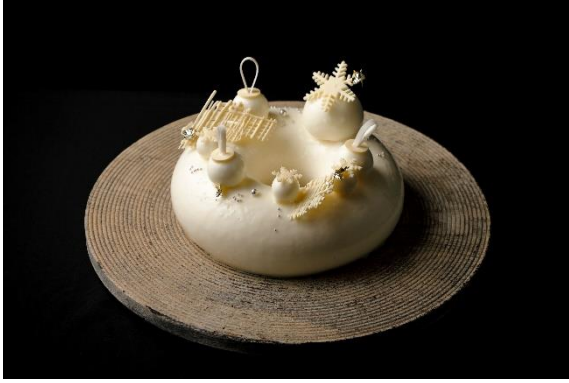
Paysage Enneigé (ペイザージュ アンネジェ)