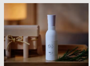
THE ROKU SPA オリジナルボディオイル