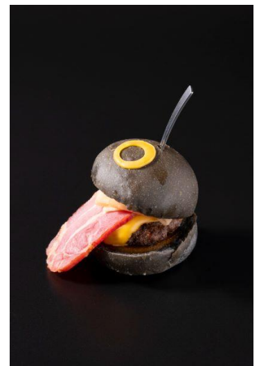
信州和牛のおぼけバーガー