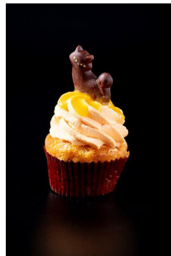
市田柿とホワイトチョコの カップケーキ

Jack-o'-Lantern(ジャック・オー・ランタン)をイメージしたパンプキン味のマカロン。