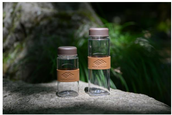
もりをまもるボトル&スリーブ