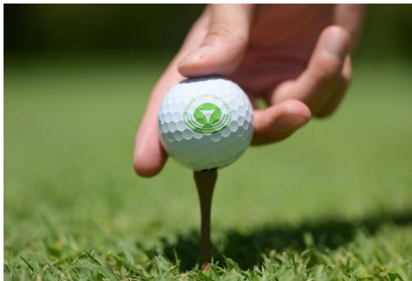
もりをまもるゴルフティー

蓋とストッパー部分には、飲食店などで大量廃棄されているコーヒー粕を一定使用し、プラスチック使用量を削減したエコなクリアボトルです。ボトルスリーブは CO2 を固めて作ったものです。森林が持つ水源涵養機能の中に「水質の浄化機能」があります。森林土壌を水が通る過程で、リンや窒素などの物質を土や植物が吸収する一方で、土壌中のミネラル成分が適度に溶け出すことによって、おいしい水を作り出します。“蓼科の水道水はおいしい”という声を聞きますが、これは蓼科の森が生み出した水だからです。ボトルに水を詰めて、トレッキングコースへ出かけて、蓼科の森の恵みを堪能してください。