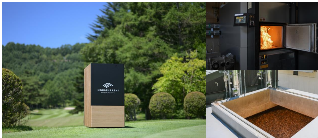
（左）CO 2 吸収・固体化装置 （右）バイオマスボイラーと燃料のウッドチップ

本取組みにおいてはカーボンニュートラルを実現している既存バイオマスボイラーへCO 2 吸収技術を実装しCO 2 排出を抑制することに加え、吸収したCO 2 を商品開発に活用することで、排出抑制および抑制したCO 2 の再利用（カーボンリサイクル）の両側面からカーボンマイナスを実現するもの。