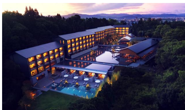
ROKU KYOTO, LXR Hotels &amp; Resorts