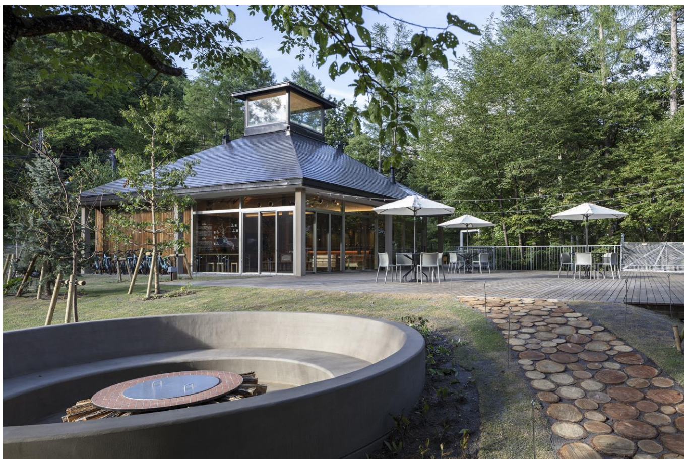
TENOKA 蓼科外観

東急不動産株式会社（本社：東京都渋谷区、代表取締役社長：星野 浩明、以下「東急不動産」）が保有し、東急リゾート&ステイ株式会社（本社：東京都渋谷区、代表取締役社長：栗辻 稔泰、以下「東急リゾート&ステイ」）が運営する東急リゾートタウン蓼科（長野県茅野市、統括総支配人：加瀬 努、以下「タウン」）に、地域連携および環境取り組み発信の拠点として「TENOKA 蓼科」を2024年7月26日（金）にオープンしたことをお知らせいたします。