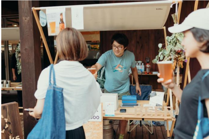
蓼科湖畔に醸造所を構える株式会社エイトピークス

TENOHA 蓼科に隣接する広場において、2024年7月26日から28日までの3日間「まちびらきマルシェ」を開催しました。地元の飲食店や木材を扱う地域事業者のブースが並び、別荘利用者やタウン内宿泊者、近隣市町村の住民の方が多く集まりました。今回のマルシェイベントをきっかけに初めてタウンを訪れたという地元の方の声も多く聞くことができたほか、地域の事業者同士の横のつながりも生まれ、地域コミュニティ創出の拠点としての第一歩を踏み出しました。