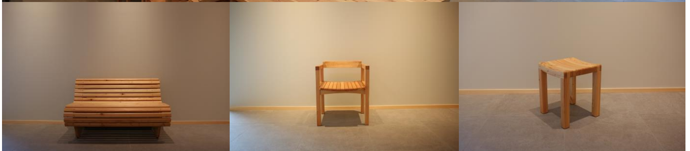
(上) TENOHA 蓼科内装 (下) タウン内で間伐したカラマツのオリ