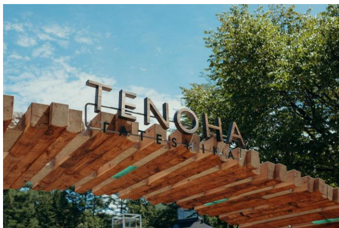
広場の入口ゲート

広場の入口ゲートには、木材だけでなく、地域の石材や、工事の際に出たガラス廃材をアップサイクルして作ったガラスブロックをあしらっています。そのゲートから繋がり広場を囲むループテラスは、タウンから始まる地域循環の輪を表現しています。