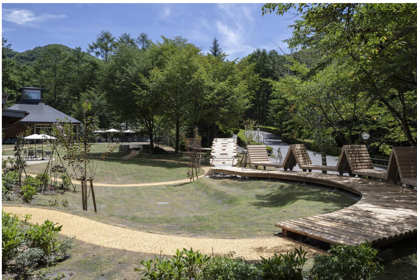
芝生と木に囲まれた緑豊かな空間