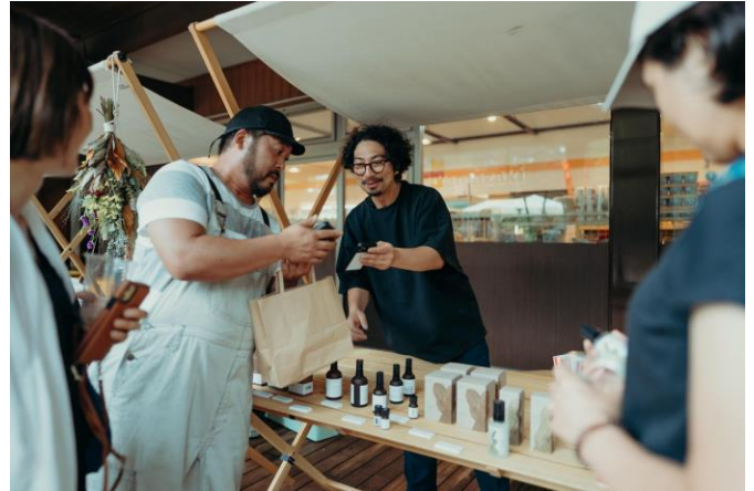
茅野市内で枝葉からプロダクトを造る株式会社ヤソ