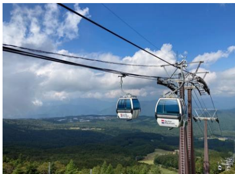
清涼感あふれる新緑シーズン