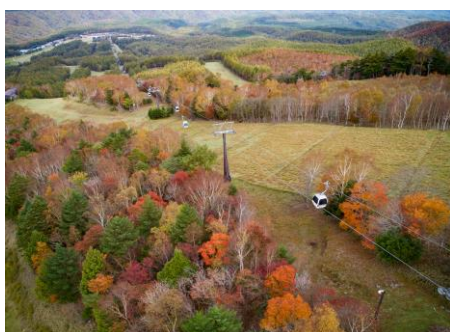
山々が鮮やかに色づく紅葉シーズン