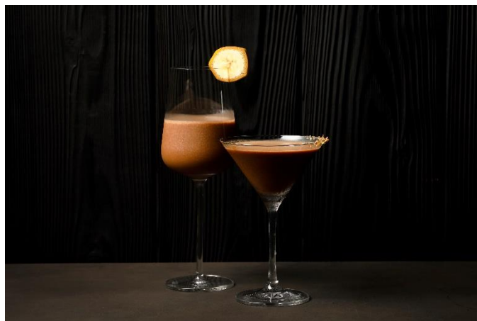
バレンタインショコラカクテル2種

バレンタインシーズンを迎えるレストラン TENJIN では、ショコラとベリーが主役の「アフタヌーンティー～St. Valentine's Day 2024～」を1か月間限定でご提供いたします。いちごのマカロンやラズベリークリームのカップケーキ、ブラックベリーのムースなど甘酸っぱいベリーで仕立てたスイーツのほか、ボンボンショコラやチョコレートの焼き菓子を詰め込んだギフトボックスが並び、レッドやピンクで彩られたスイーツ&セイボリーが大切な方とのティータイムに華を添えます。