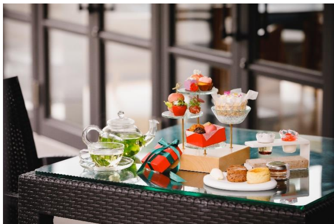
アフタヌーンティー～St. Valentine's Day 2024～