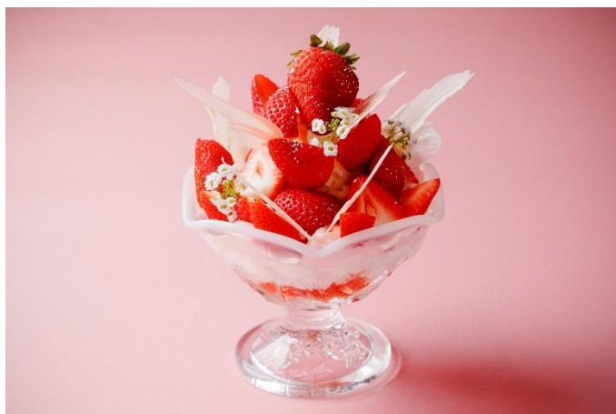
苺ミルフィーユパフェ

ROKU KYOTO, LXR Hotels & Resorts (京都市北区、総支配人：西原吉則、以下 ROKU KYOTO)は、2024年1月15日(月)～3月31日(日)の期間中、レストラン「TENJIN」にて、旬を迎える苺を使用したこの季節だけの苺パフェと苺カクテルをご提供いたします。