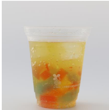
蒟蒻バブルソーダりんご風味