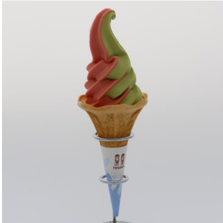
コキアソフトクリーム