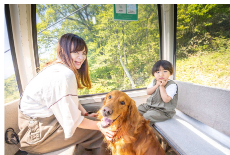
ペット同伴OKのゴンドラ