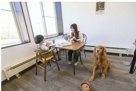
レストラン内に愛犬と一緒に お食事が出来るスペース有り