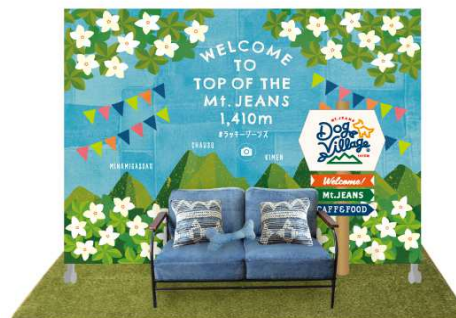
店内フォトスポット(イメージ)