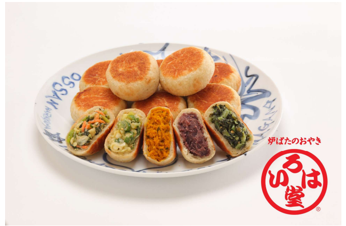
いろは堂のおやき