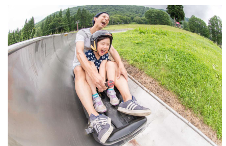
人気のスーパーボブスレー