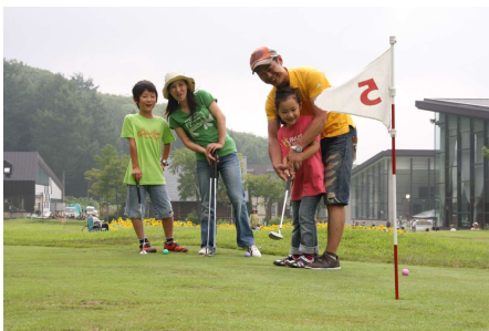
家族で楽しいパターゴルフ