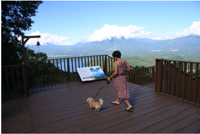
テラスは愛犬と一緒に楽しめます（中型犬まで） *リフト乗車はゲージが必要、無料レンタルあり

8月上旬までが見頃です。雄大な山々と湖の自然豊かな風景を、刷新したメニューと共に、リフトに乗ってテラスに訪れるお客様へお届けいたします。