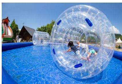
子供がはしゃぐキッズパーク