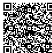
「東急ステイ 公式アプリ」