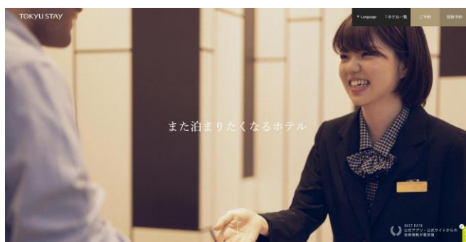
東急ステイ公式サイト ( https://www.tokyustay.co.jp/ )