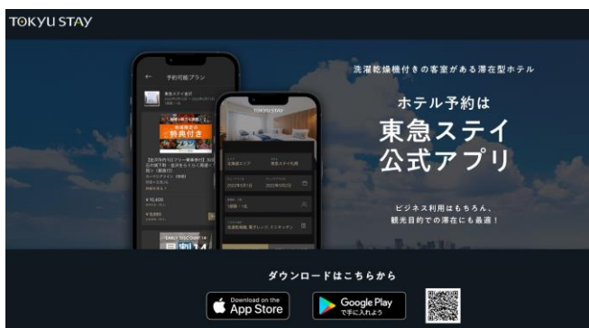
東急ステイ公式アプリ ( https://www.tokyustay.co.jp/tokyustayapp/ )