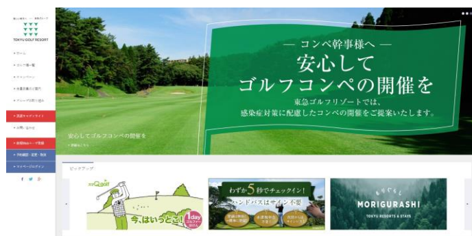
東急ゴルフリゾート公式サイト ( https://www.tokyu-golf-resort.com/ )