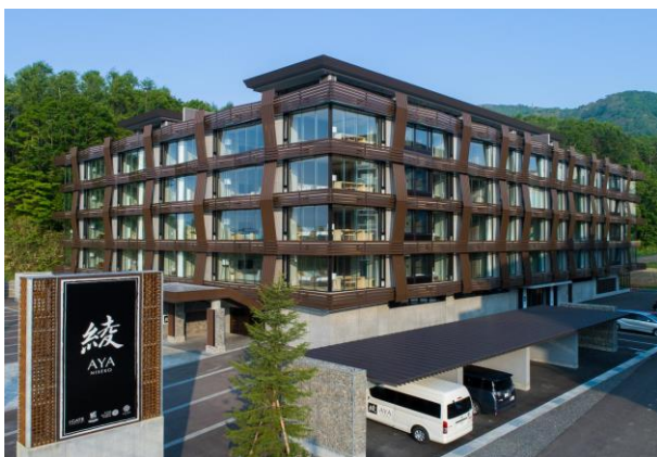
ラグジュアリーな外観デザイン

長期間でのワーケーション滞在をご希望の方には「綾ニセコ」をおすすめいたします。一部客室にはキッチンや洗濯乾燥機など、長期滞在をされる方にも安心な設備が充実しており、ラグジュアリーなデザインの客室で優雅なニセコライフを満喫していただけます。館内には宿泊者のみ無料で利用可能な天然温泉やトレーニングジム、本格的なマッサージで極上のリラクゼーションタイムをご提供する綾スパ(別料金・要予約)など、ロングステイでも飽きることなく充実したご滞在を提供いたします。