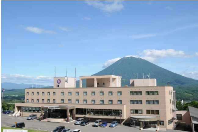
羊蹄山に抱かれるホテルニセコアルペン

ワークプレイス「タンタ・アン」をご利用いただく方のご滞在には、「タンタ・アン」から徒歩5分の「ホテルニセコアルペン」をおすすめいたします。ホテル2Fレストラン「スラローム」では北海道産食材にこだわったお食事をご提供しています。また、天然温泉やサウナ、岩盤浴、温水プールなどのリラクゼーションも充実し、仕事の疲れを癒してリラックスできるご滞在を提供いたします。