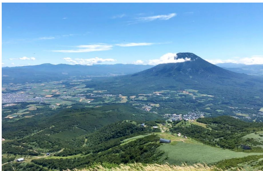
ニセコアンヌプリからの景色（羊蹄山と倶知安市街地）