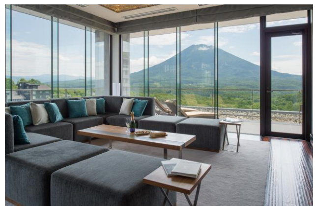
羊蹄山を一望できるお部屋も