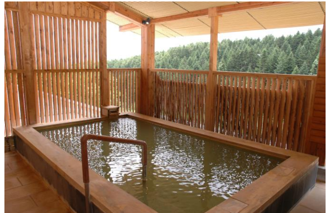
天然温泉の露天風呂