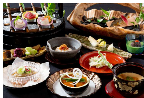
床会席料理(イメージ)