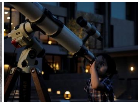
ROKU KYOTO 天体観望宿泊プラン

自然豊かな京都・洛北の鮮やかな緑の景色に包まれる夏の ROKU KYOTO。季節の食材や地元野菜を多く使用し、健康的で美しくドレスアップした料理をご提供するレストラン「TENJIN」では、夏ならではのスイーツや食欲をそそるスタミナ料理を販売いたします。6 月から提供を開始する夏のアフタヌーンティーは、レモンやグレープフルーツなどの柑橘を使用した甘酸っぱく爽やかなスイーツで構成され、涼しげなティータイムを演出します。夏の暑さが厳しくなる 7 月からは、パフェとかき氷がひとつになったパフェ氷「夏 麓 氷」2 種が登場します。また、夏に旬を迎える食材をふんだんに取り入れたランチやディナーでは、とろけるような食感が特徴の京丹波平井牛のローストビーフをメインにした特別コースを 7 月から 8 月の 2 ヶ月限定で販売いたします。ワゴンサービスにより、シェフが目の前で切り分けてご提供するライブ感あふれる演出もお楽しみいただけます。