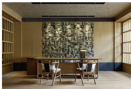
スパレセプション