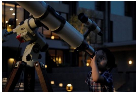
天体観望イメージ