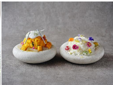
パフェ氷「夏 麓 氷」2 種