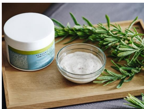
ボディスクラブイメージ

肌の露出が多くなるこの季節に、ご自身のお肌を磨き上げるスクラブトリートメントをご用意いたします。温めたボディオイルを全身に塗布し、植物酵素の働きで乾燥肌を和らげた後、お客様の肌体質に合わせてお選びしたボディスクラブで身体の余分な角質を丁寧に取り除きます。紫外線の気になる夏本番に欠かせないお手入れ、爽やかな香りのスクラブがなめらかなお肌へと導きます。トリートメント終了後には、アフタードリンクとしてホテル敷地内で採れたフレッシュなミントを使用したミントティーをご用意いたします。