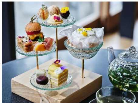
アフタヌーンティー -kitayama sugi- l'été