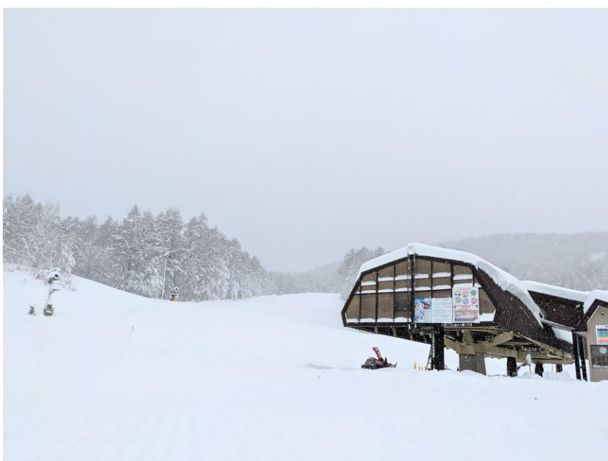
2021年11月25日のゲレンデの様子

※定価リフト券ご購入者の方に12月1日～12月24日まで使えるリフト半額券をプレゼント