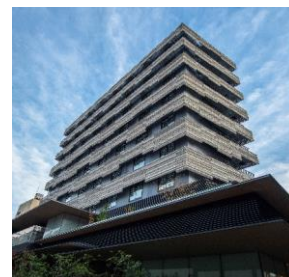
東急ステイ京都新京極通