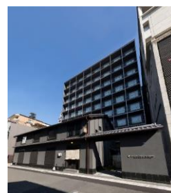
東急ステイ京都両替町通

東急不動産ホールディングスグループでは、本施設以外にも隣接する「東急ハーヴェストクラブ京都鷹峯&VIALA」をはじめ、昨年開業した「nol kyoto sanjo」(2020年11月)や、「東急ステイ京都両替町通」(2017年11月開業)、「東急ステイ京都新京極通」(2018年12月開業)がございます。様々な需要を捉え、今後もお客様に満足いただける施設を提供してまいります。