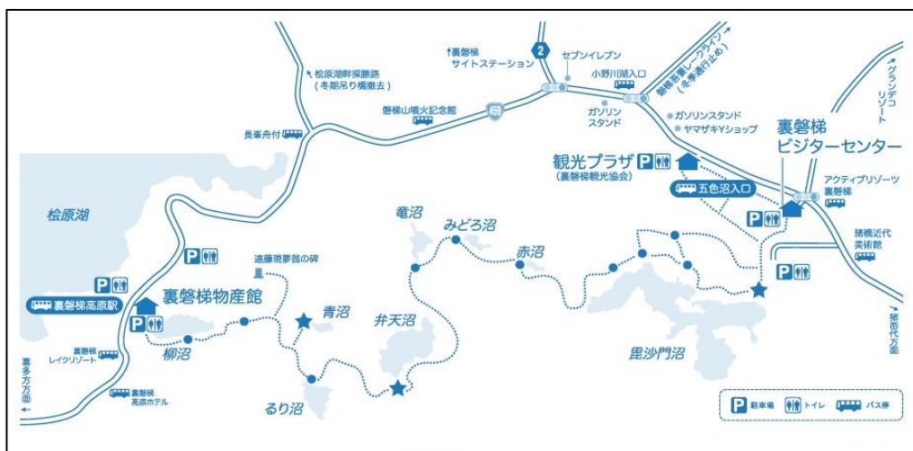
五色沼湖沼群トレッキングコースマップ