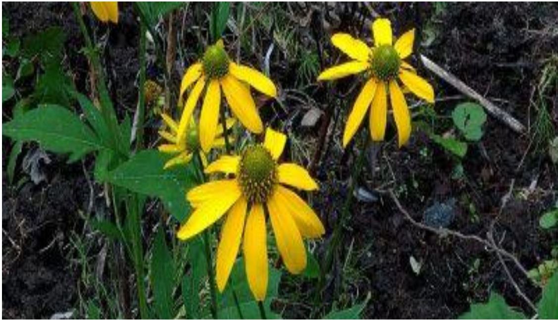
オオハンゴンソウ