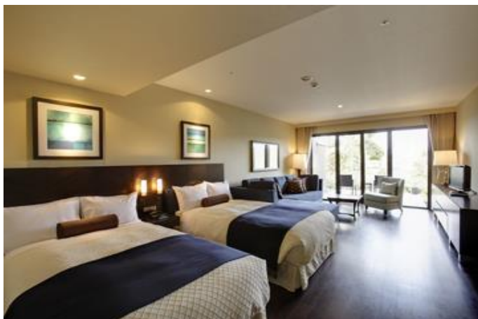
スタンダード洋室

館内には、古からの名湯「金湯」と「銀湯」を汲み上げた温泉大浴場やボディケアスタジオ、リラクゼーションスパ、屋内温水プールなどもあり、心身ともに癒される様々な空間でゆったりとお寛ぎいただけます。