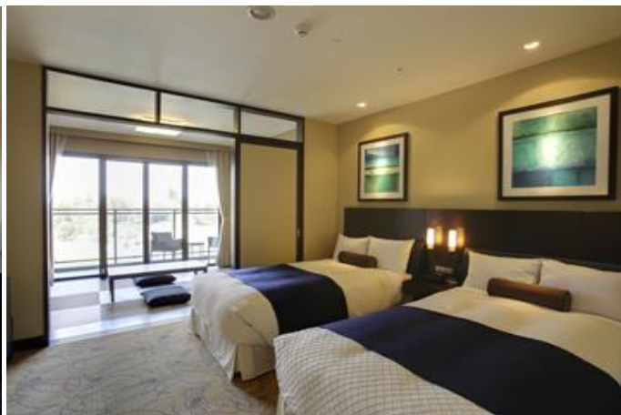
スタンダード和洋室