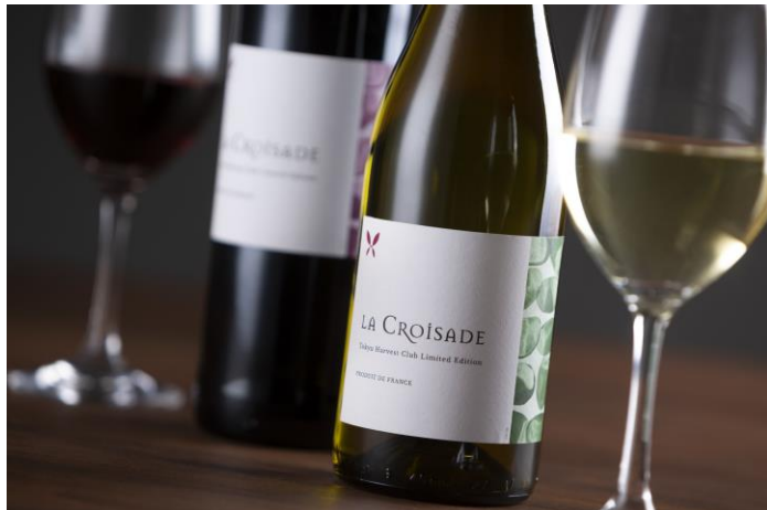
ホテルオリジナルの赤・白ワインは鍋にも合います