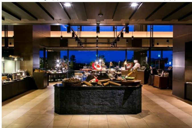
シックな設えの店内に色鮮やかな数多くの料理が美しく並びます

※緊急事態宣言中は、レストランでの酒類提供をしておりません。また、営業時間等に変更がある場合がございます。詳しくはホームページにてご確認ください。