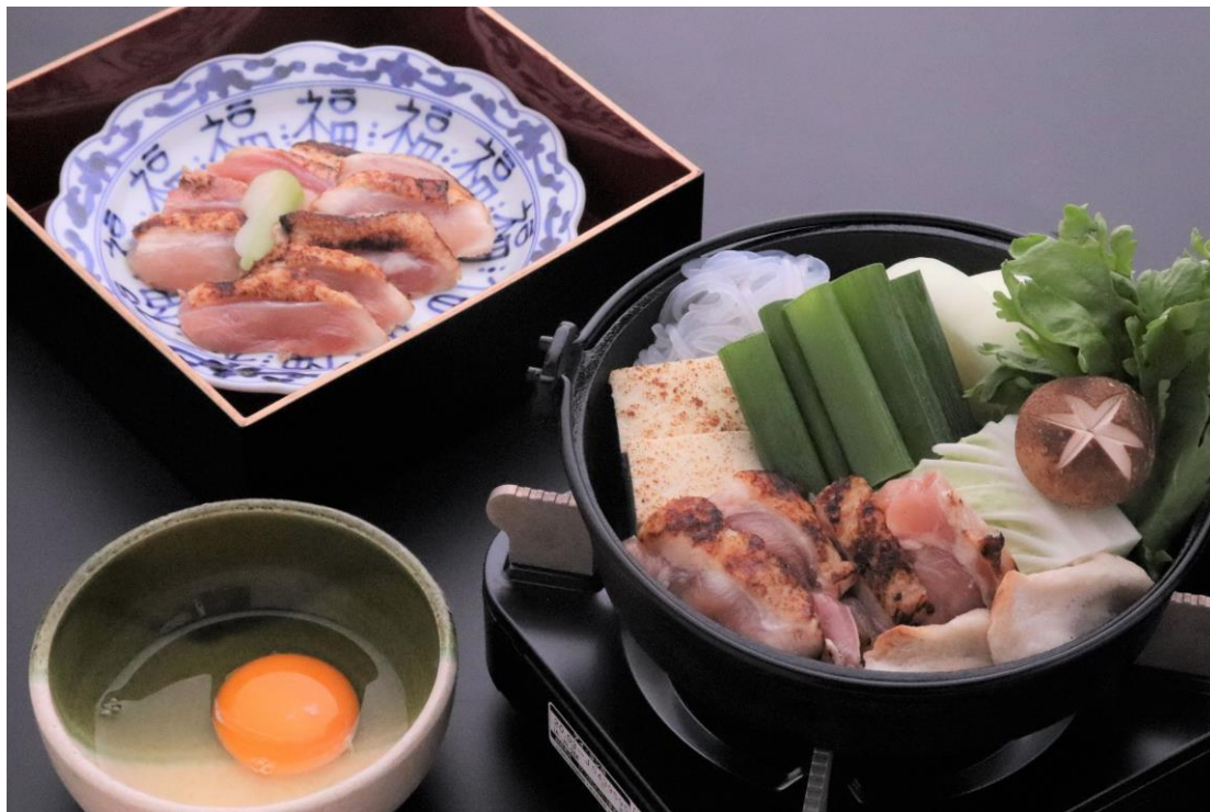
兵庫県のブランド鶏を甘辛のたれで煮込み地玉子を絡めていただく「ひょうご味どりすき鍋」

料金：「一人鍋 ヘルシー鍋/ひょうご味どりすき鍋」 各5,500円 ※3日前までの要予約