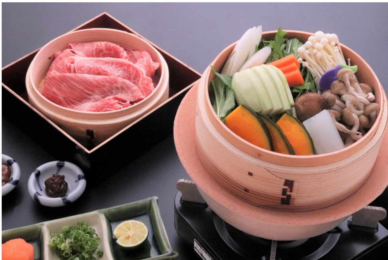
秋野菜と豚肉を蒸籠で蒸し上げ特製味噌でいただく「ヘルシー鍋」

東急リゾート&ステイ株式会社（本社：東京都渋谷区、代表取締役社長：田中 辰明）が兵庫県神戸市で運営するリゾートホテル「有馬六彩」では、buffetレストラン「The Dining 万彩」において、お肉と旬のお野菜をたっぷり詰め込んだ「ヘルシー鍋」と、兵庫県のブランド鶏“ひょうご味どり”を使用した「ひょうご味どりすき鍋」を2021年9月1日（水）から2ヶ月限定の秋のおすすめ一人鍋メニューとして販売いたします。「The Dining 万彩」がこの秋ご提供する「buffet」と「一人鍋」をご家族やお仲間と一緒に食すもよし、それぞれ好みのメニューを選んで食すもよし。ぜひ「有馬六彩」で食欲の秋をお楽しみください。