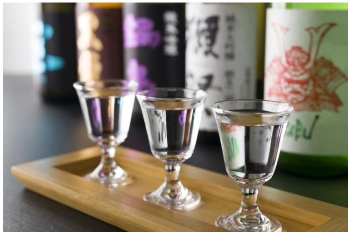
地元・兵庫の銘酒から国内外の美酒を取り揃えています

料理と合わせてお楽しみいただける日本各地の銘酒やワイン、ノンアルコールドリンクなど厳選したお飲み物も幅広くご用意しております。その日の気分やお好みをソムリエに伝えて、料理とのペアリングも可能です。