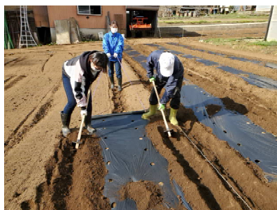
畝作り、これが大変な重労働でした。