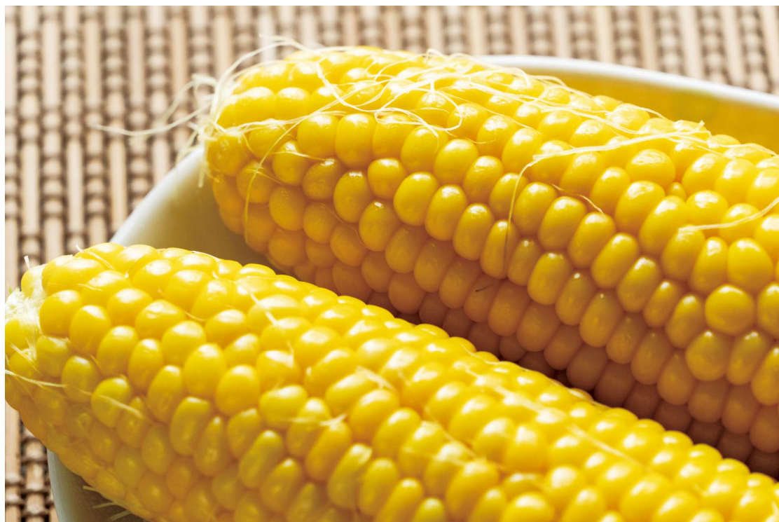
信濃町のとうもろこし

長野県 SDGs 推進企業のタングラムでは、地元信濃町のブランド野菜である「とうもろこし」を通して、地産地消・地域連携・継続可能な地域特性を活かした体験プログラムの開発などを目標に、「タングラムもろこし村プロジェクト」を今年4月よりスタート。地元農家さんに協力していただき、畑作りや種まきからスタートしたプロジェクトは苗植えも終了。雑草取り作業などを継続し順調に育っていて、夏の収穫を待つばかりです。夏休みは子供たちと「とうもろこし収穫体験」はいかがですか？約3,000本のとうもろこしが皆様をお待ちしております。