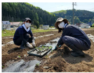
ひと苗ずつ丁寧に畑に植え替えました。