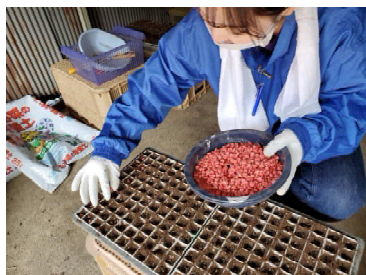
一粒ずつポットに「種植え」