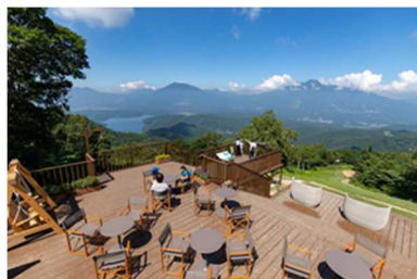
野尻湖テラスリフト

「遊ぶ、泊まる、癒す」がひとつになったホテルタングラムには家族が喜ぶ施設が充実。新規のとうもろこし収穫体験の他に野尻湖テラス、キッズパーク、スーパーボブスレー、バターゴルフや野尻湖SUP体験などがありタングラムでの夏を満喫いただけます。夏休みの楽しい思い出作りは信州ホテルタングラムへ！