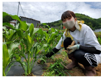
大事に育てた苗もこんなに大きくなりました。