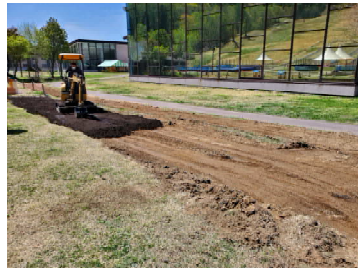
ホテルの目の前にも畑を作りました。