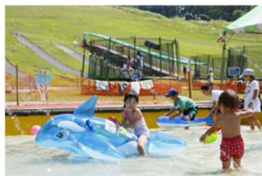
じゃぶじゃぶプール