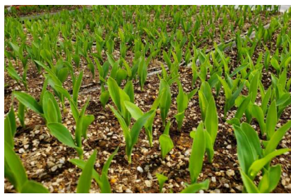
種植えから2週間「発芽」