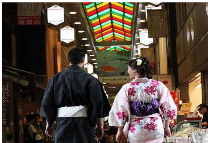
浴衣での錦市場を散策

浴衣を着付けが終わったら、京都散策へ。そのまま徒歩で、錦市場でお買い物。京裳庵から最寄駅までは徒歩3分程。電車やバスで二条城や祇園など、神社仏閣や京都の風情を味わいに行くのもおすすめです。