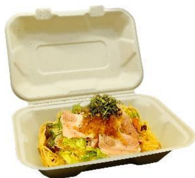
とちぎゆめポークしゃぶしゃぶサラダスパ ¥1,000