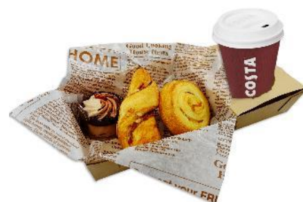
コスタコーヒー&ブレッド BOX セット ¥900