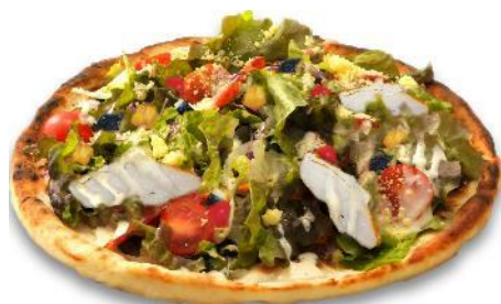
那須鶏スモークチキン夏野菜ピザ ¥1,650