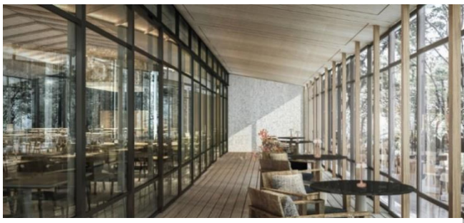
TENJIN Engawa (イメージ)

水盤に面した幻想的な空間では、カフェタイムにはアフタヌーンティーセットを中心としたメニュー、夜は酒類や軽食を中心としたメニューをご用意いたします。風に揺れる水面を眺めながら贅沢な時間をお過ごしください。