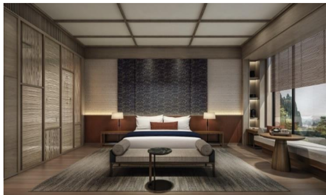
スイート ベッドルーム (イメージ)