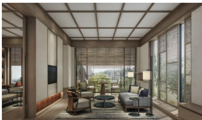
スイート リビングルーム (イメージ)

ROKU KYOTO を代表する 2 室は、各 100 ㎡と広々とした空間でゆったりお過ごしいただけます。バスエクスペリエンスの演出や客室内のアートワーク、アメニティ、備品など細部にこだわり、最上級のご滞在をお約束します。天神川越しに山麓を望む ROKU スイート、鷹峯三山の頂を望む PEAK スイート、それぞれで異なる四季折々の景色をお楽しみいただけます。