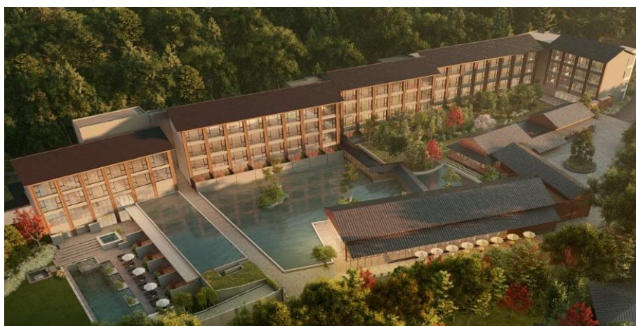
ROKU KYOTO, LXR Hotels &amp; Resorts 外観（イメージ）

秋の大型連休を前に、「With コロナ」時代に安心・安全で快適なご滞在をしていただける開放的な施設として、市街地からほど近く、自然豊かな洛北の地に、ROKU KYOTO, LXR Hotels & Resorts はオープンいたします。ホテルが位置する鷹峯エリアは、400年以上前に本阿弥光悦（ほんあみこうえつ）が芸術村を築き上げ、才能ある芸術家を世に輩出してきた琳派（りんぱ）発祥の地であり、その歴史や背景、また豊かな自然に囲まれた環境から、「Dive into Kyoto」をコンセプトに、リゾートでの滞在を通して知る人ぞ知る京都の魅力を提供いたします。