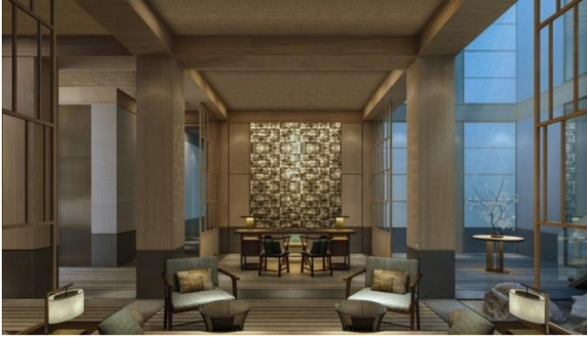
スパレセプション (イメージ)

自然哲学の5つの思想をこの土地が持つ自然の恵み「 キョウト エレメンツ Kyoto Elements」で形成し、ボディ・マインド・スピリットへホリスティックにアプローチするオリジナルトリートメントをご提供いたします。サーマルプールやフィットネスとも連動した ROKU KYOTO オリジナルプログラムもお楽しみいただけます。