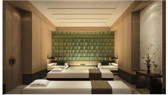
トリートメントルーム (イメージ)