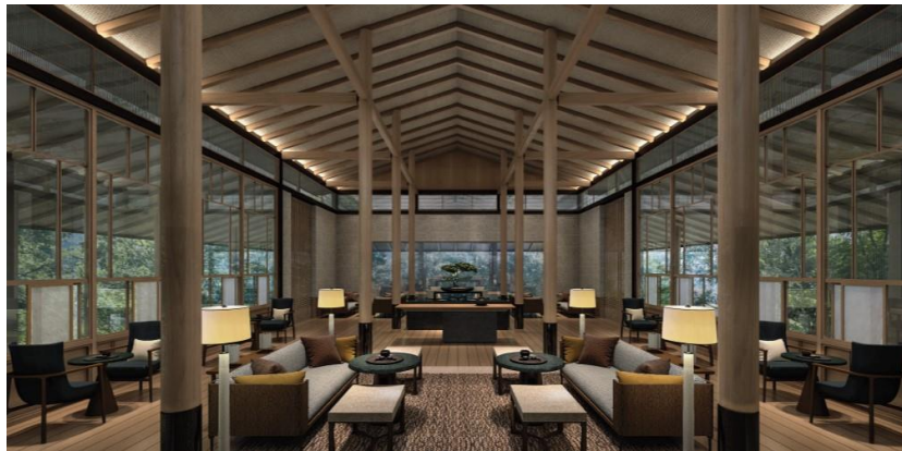
Tea House (イメージ)

オリジナルブレンドのお茶やドリンク類をお好きな時間にお楽しみいただける Tea House。ティーセレモニーなどの各種イベントやアクティビティを開催する予定です。17時～18時30分の間は一部のお客様を対象としたエクスクルーシブな空間をご用意いたします。