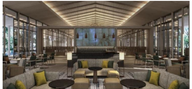
TENJIN バー (イメージ)