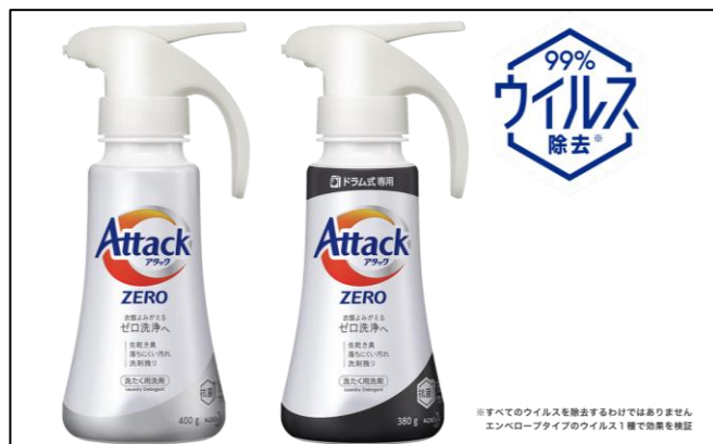
左：花王製「アタック ZERO」 右：花王製「アタック ZERO ドラム式専用」