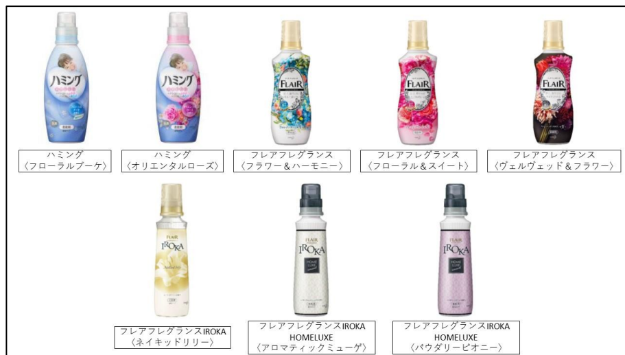
選べる最大 8 種類の柔軟剤

今回、洗濯乾燥機の利便性・機能性をさらにお客様に実感していただくため、フロント前に「柔軟剤バー」を設置し、滞在中の洗濯の価値をさらに深掘りしてまいります。以前より、女性を中心に多くのお客様から柔軟剤の提供についてご要望をいただいておりますが、このたびお客様の声にお応えする形で、花王製の柔軟剤の貸し出しボトルを最大 8 種類設置するトライアル運用も実施いたします。実際に香り確かめていただき、お客様ご自身の好みに合わせてお選びいただくことができます。