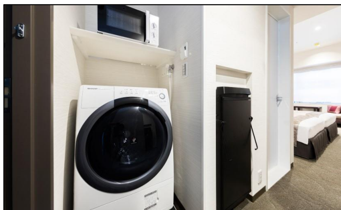
他社のホテルにない独自の強みである 客室内設置の「洗濯乾燥機」

今回、以前より関係性のあった二社が、「ホテル滞在×洗濯」という切り口で、「アタック ZERO」及び「アタック ZERO ドラム式専用」を活用した新たなコラボレーションを実現いたします。たとえば、公共交通機関を利用して来られたお客様が、ホテルにチェックインしてすぐに衣類を洗濯し、清潔な身のこなしとなってお過ごしいただける、そのような利用シーンを想定しております。洗剤は客室内に設置しておりますので、フロントでお客様に粉洗剤をお渡しする際の接触機会を減らすことにもつながります。洗剤のボトルは、客室清掃の都度除菌対応をしておりますので、安心してご利用いただけます。