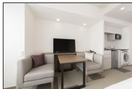
東急ステイ青山プレミア