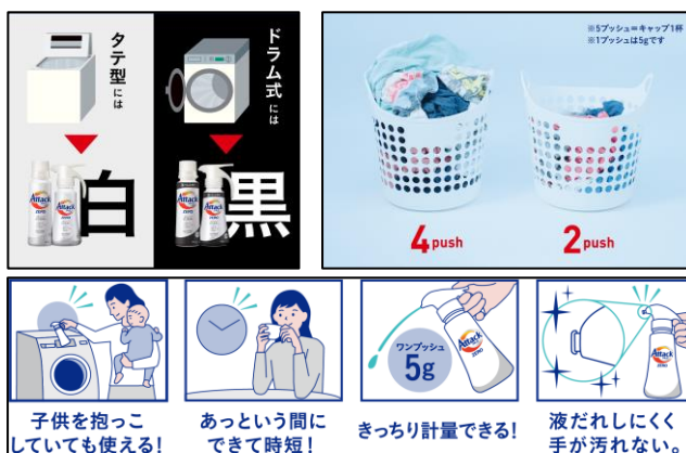
洗濯物の量に合わせて、片手で簡単にプッシュして使用できます