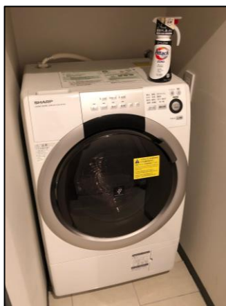
客室内設置イメージ