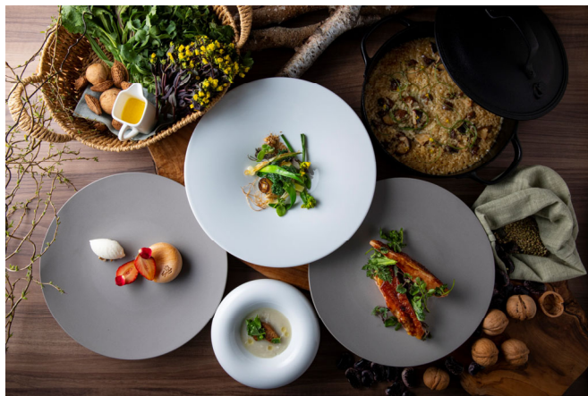
コースメニュー（イメージ）