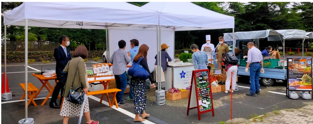
The Market の様子

旧軽井沢 KIKYO では、これからも地域の生産者と共に歩む新しいホテルのカタチを提案し、そしてお客様に満足いただけるホテルを目指してまいります。