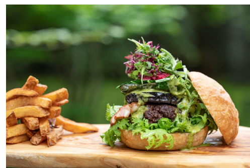
KIKYO オリジナルバーガー

生産者とお客様をつなげる場所でありたいという想いを込めた旧軽井沢 KIKYO オリジナルバーガーです。