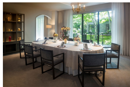
プライベートルーム（広さ：55㎡）

サービススタッフが専属でアattendし、プライベートでラグジュアリーなディナータイムを演出いたします。